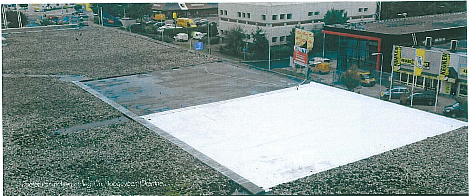
Roefol van Echten college in Hoogeveen (Drenthe).